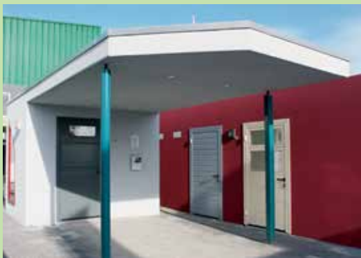
Der Carporto kann als Einzel- oder Reihenanlage ausgeführt werden. Unterschiedliche Längen und Breiten des Abstellraums wie der dazugehörigen Carportplatte passen sich Ihren Wünschen individuell an.